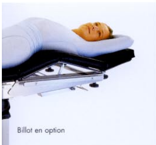
Billot en option

Autres accessoires : Voir le catalogue MAQUET 1000 – Accessoires pour tables d'opération.