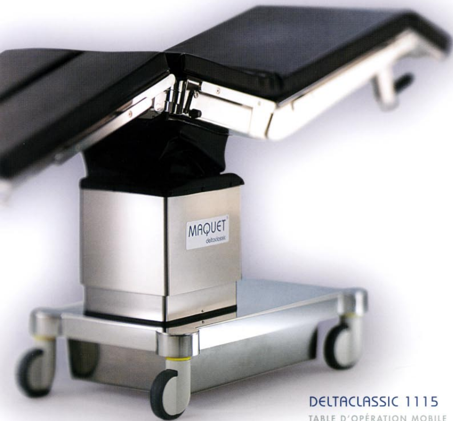
DELTACLASSIC 1115 TABLE D'OPÉRATION MOBILE